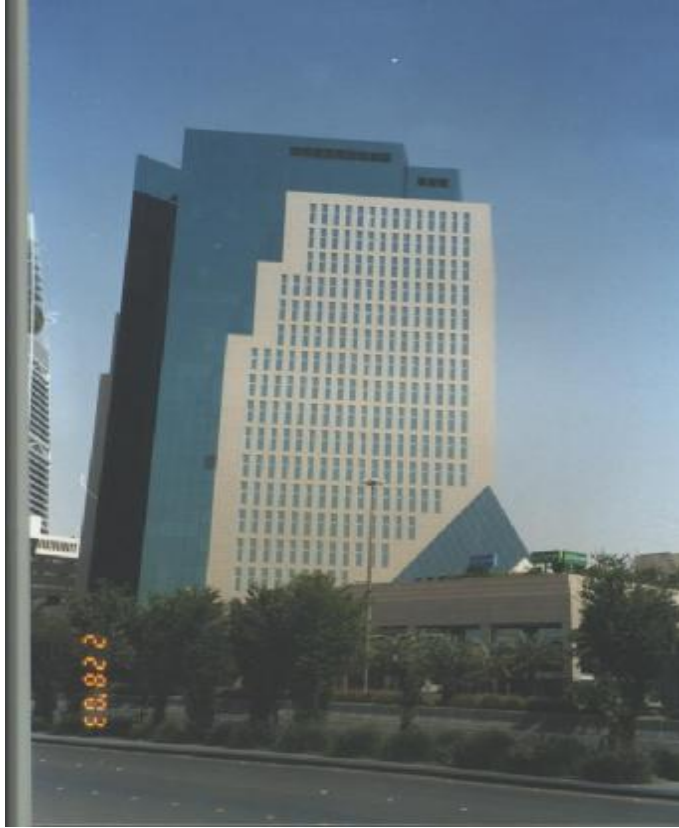
الشكل رقم (2): الواجهة الجنوبية الغربية لبرج التعاونية للتأمين.

5 - المعلومات عن المشروع مستقاة من مدير إدارة أبراج التعاونية