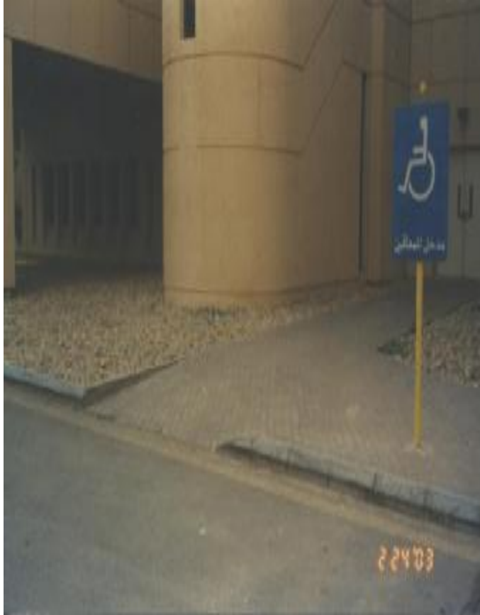
الشكل رقم (9): لوحة إرشادية خارجية تبين مداخل المعاقين بجانب المنحدر الغاطس بالرصيف.