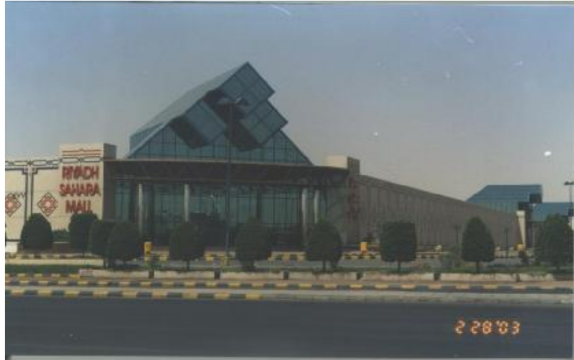
الشكل رقم (5): المدخل الرئيس لمركز صحارى الرياض

يقع على تقاطع شارعى الملك عبد العزيز والأمير عبد الله بن عبد العزيز. تم افتتاح المشروع برعاية الأمير عبد الله بن عبد العزيز ولي العهد ورئيس الحرس الوطني. مساحة أرض المشروع (50.000 م 2 ) وتملكه مؤسسة الرقيب (أنظر الشكل رقم 5). صمم المشروع مكتب الشفري للاستشارات الهندسية بالتعاون مع معماري إيطالي. أفتتح المشروع في عام 1419هـ. (8)