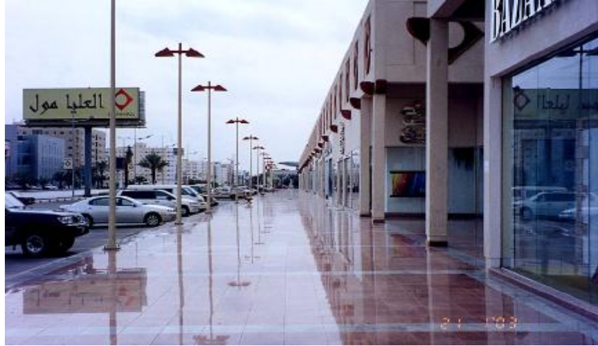
الشكل رقم (3): الواجهة الشرقية للعلياء مول.