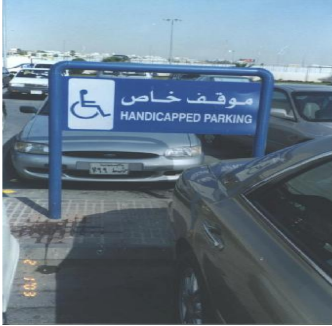
الشكل رقم (10): لوحة إرشادية خارجية تبين مواقف المعاقين.

الاشتراطات الأخرى مثل المنحدرات, الأرصفة, الأبواب, الممرات, المصاعد, ودورات المياه متوفرة ولكن بتفاوت من مبنى لآخر ويمكن للمعاقين استخدامها. ما يلي تحليل مفصل لكل اشتراط على حدة: