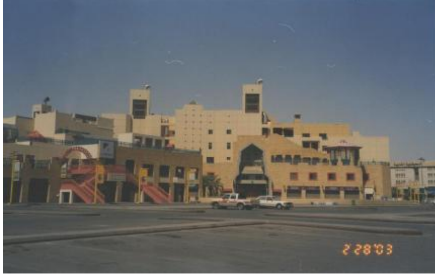
الشكل رقم (3): الواجهة الشمالية الشرقية لمركز التعمير بالرياض.